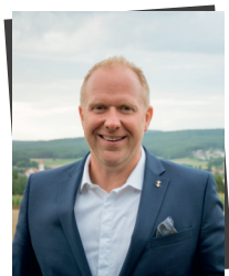
Marcus Eichenmüller 1. Bürgermeister der Stadt Schnaittenbach